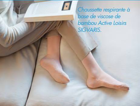
Chaussette respirante à base de viscose de bambou Active Loisirs SIGVARIS.