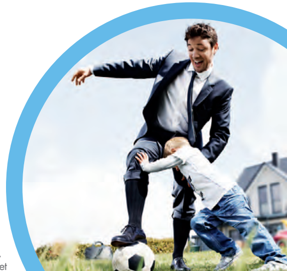
Chaussette médicale sans couture visible.