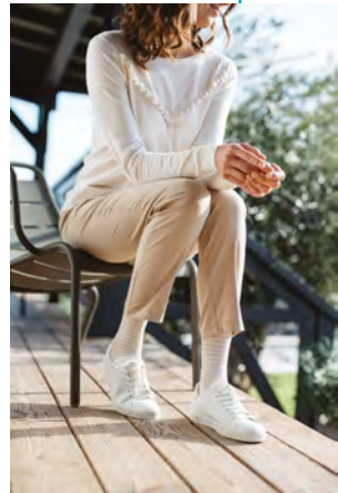
Chaussettes ultra tendance Styles Marinière, homme ou femme, SIGVARIS.

Il s'agit d'un traitement mécanique qui permet de prévenir l'apparition des varices, de freiner l'évolution de la maladie et de réduire notablement la douleur et l'œdème. Les chaussettes, bas ou collants de compression sont composés d'un textile spécifique qui vient exercer une pression dégressive de la cheville vers la cuisse. Cette action va empêcher la dilatation de la veine et faciliter le retour veineux. Le traitement est indispensable pour prévenir et soigner les thromboses ainsi que les complications cutanées telles que les ulcères de jambes, par exemple.