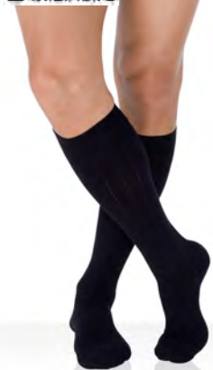
Chaussettes Legger® pour homme, INNOTHERA