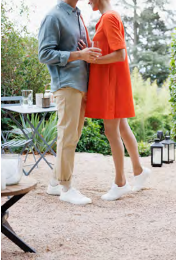
Bas auto-fixant Styles Transparent femme et chaussettes Confort Fraîcheur homme SIGVARIS. A base de lin, idéal en été.